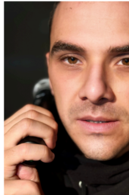
Tre momenti degli spettacoli a fACTORY32 per la International Weekend